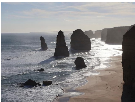
• Twelve Apostles