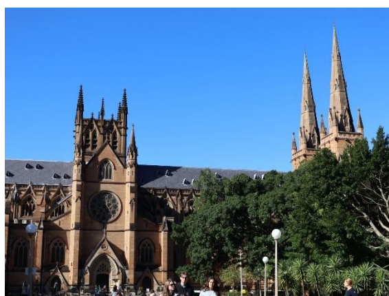
• St Marys Cathedral