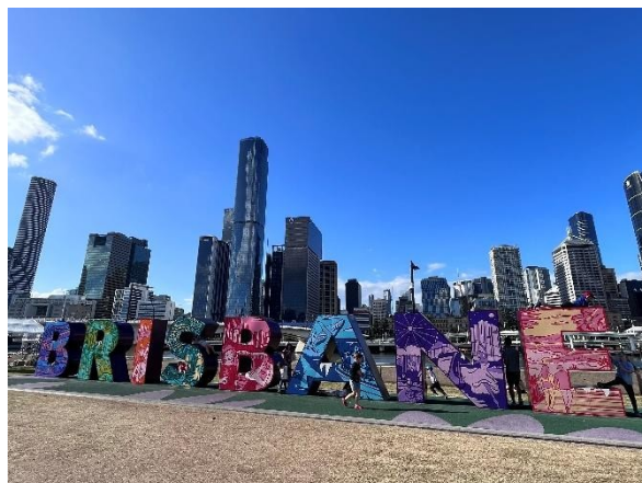
• South bank