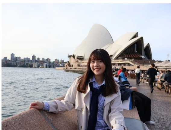
• Sydney Opera House