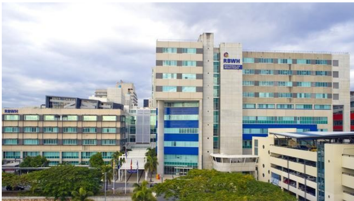
• Royal Brisbane and Women's Hospital

對我而言，實習期間最大的挑戰是語言。無論是交班、與患者的互動、澳洲的俚語，甚至聽懂不同護理師的英文口音與語速，都需要大量的練習與適應。然而正因為這些困難，我在語言表達與臨床溝通方面都有明顯進步，也讓我學習到如何在壓力中建立自信、有效表達與主動提問，對我未來的護理職涯是一項非常寶貴的養分。