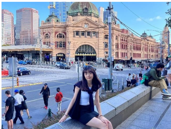
• Flinders Street Railway Station

我也安排了前往其他城市的旅行，例如墨爾本與雪梨，參觀當地著名地標與自然風景。 透過這些旅程，我不僅親身體驗澳洲各地的文化差異，也更深刻體會「讀萬卷書，不如行萬里路」。