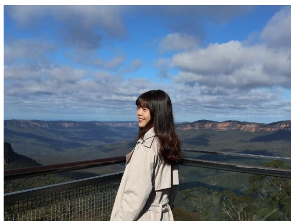
• Blue Mountains