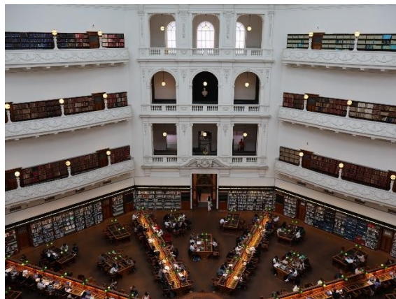
• State Library Victoria